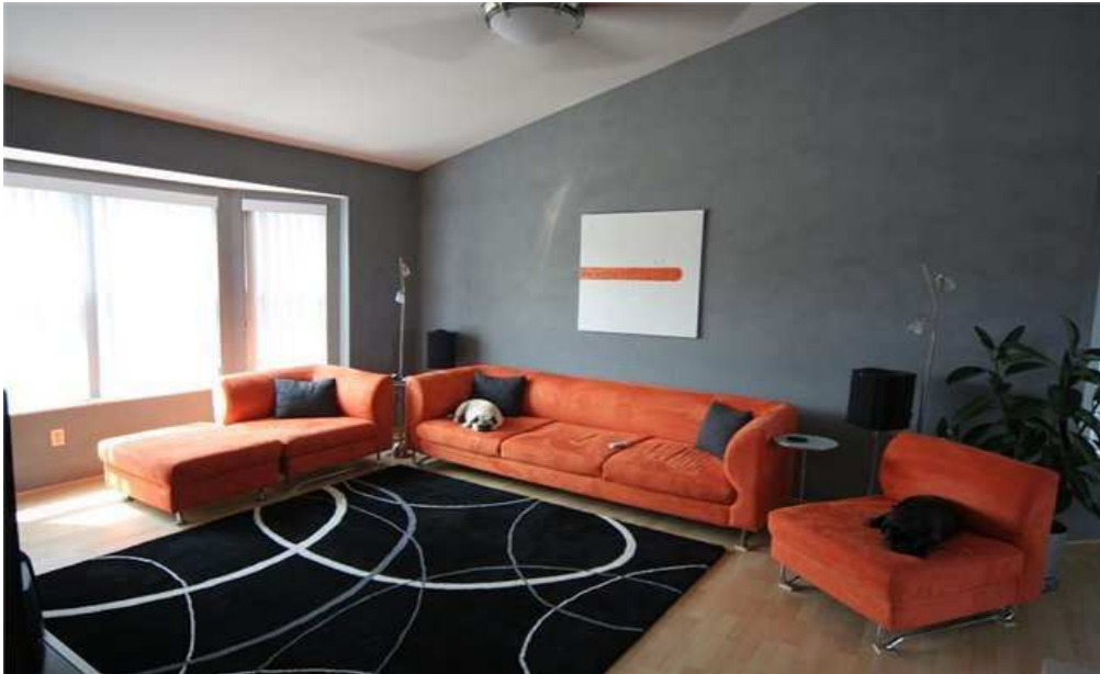
Картинка 1 Minimalism Simple colors Space Light Comfort

2. Опишите картинку 2, используя ключевые слова. Выразите свое мнение о стиле комнаты. Ответьте на 3 вопроса своего партнера.