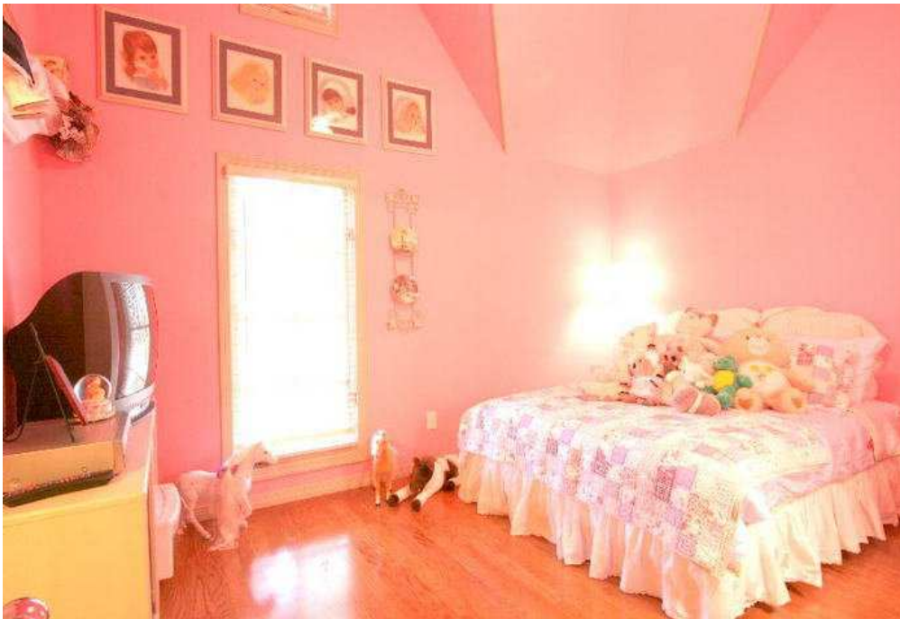
Картинка 2 Cozy Romantic Girlish Style Light